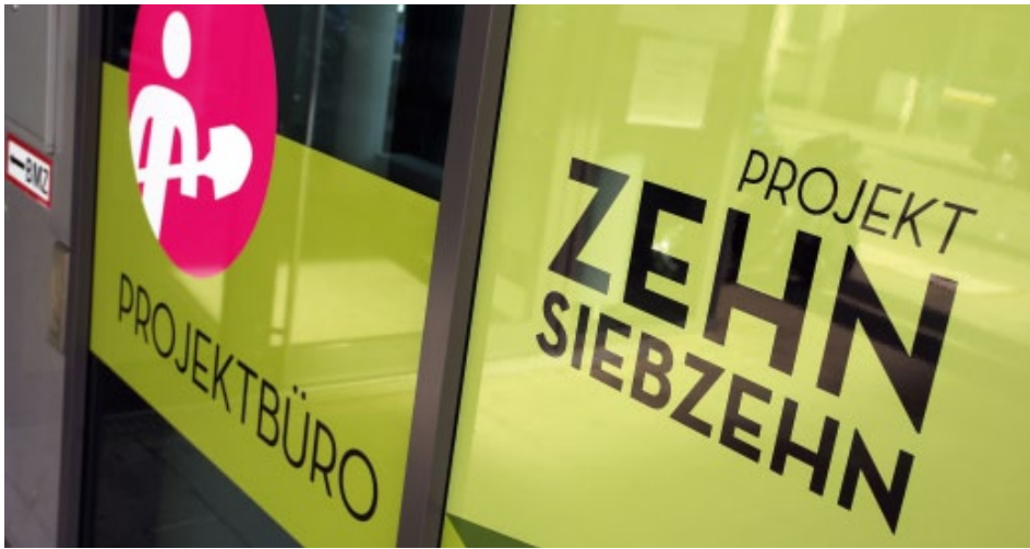
Hier geht's rein: das neue Projektbüro der infra in der Kurt-Schumacher-Straße.

Projektbüro der infra in der Kurt-Schumacher-Straße eröffnet