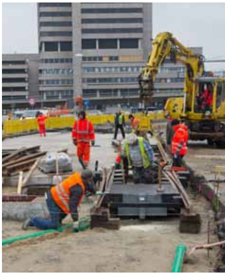
Die neue Weiche an der Kreuzung Lister Meile/ Rundestraße wird eingebaut.

Der Streckenausbau für das Projekt Zehn Siebzehn in der Lister Meile hat begonnen. Den Auftakt machte Ende Februar eine in Tschechien gefertigte doppelte Kreuzungsweiche in Höhe der Rundestraße. Es war Millimeterarbeit, die komplexe Gleisanlage in die exakte Position zu bringen. Die Weiche wurde als Erstes eingebaut, um den Kreuzungsbereich Rundestraße möglichst schnell wieder für den Verkehr freizugeben. Nach dem Einbau der Weiche geht der Gleisbau nun in beiden Richtungen weiter. Es werden die künftigen Bahnsteiggleise eingesetzt, zwischen die dann Ende April die Fertigteile des Hochbahnsteiges eingebaut werden. In die andere Richtung beginnt der Gleisbau in die Unterführung Lister Meile. Die Bauarbeiten sind damit im Zeitplan.